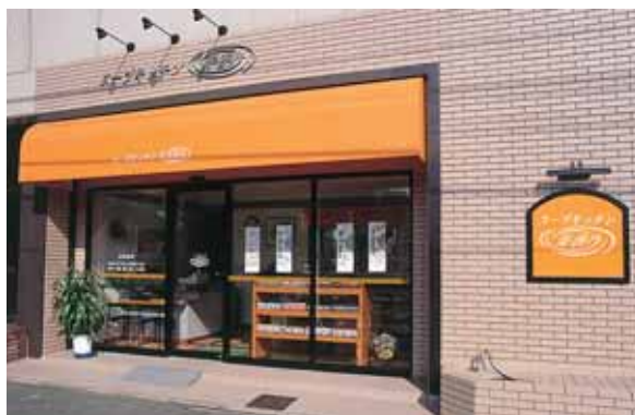
アンテナショップ「スープショップ寿香乃」 本社1階 当社の商品を購入していただけます。